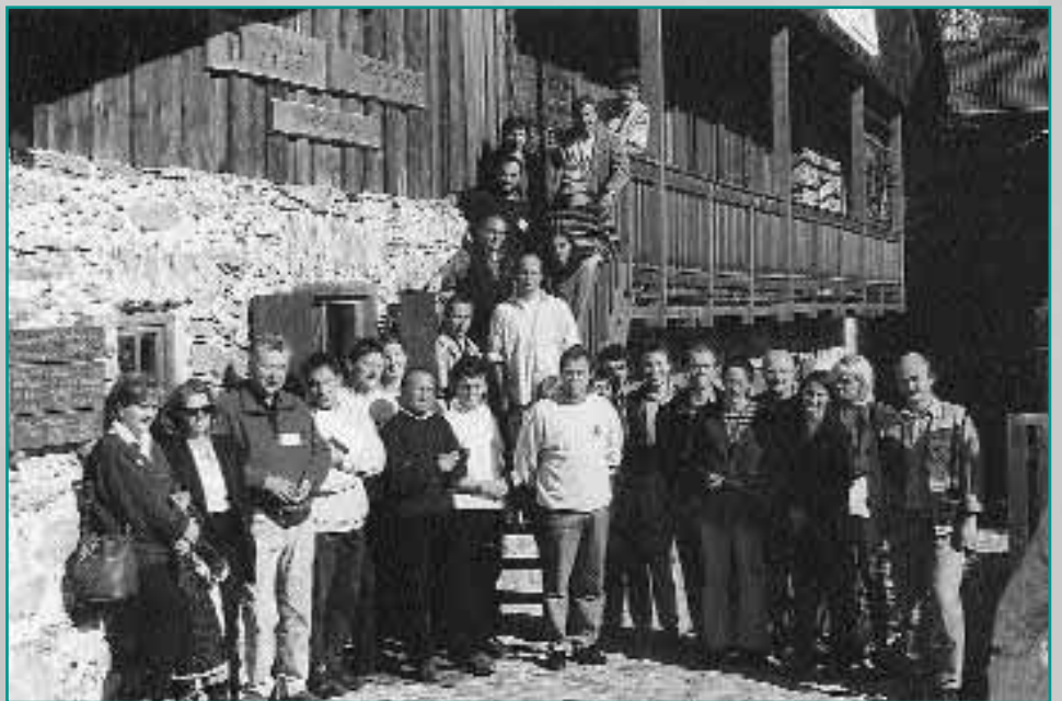
Participants à l'atelier de travail de Matrei sur la politique de communication des espaces protégés alpins

Le thème de la communication a réuni le 23 avril 1998 à Matrei (Autriche) près de 35 responsables d'espaces protégés alpins. Cette manifestation a été organisée par le Réseau Alpin des Espaces Protégés conjointement avec le Parc national des Hohe Tauern. Les spécialistes de la communication ont ainsi eu l'occasion d'échanger leurs connaissances et savoir-faire sur leurs réalisations, du simple dépliant à l'outil multimédia jusqu'aux sites INTERNET des parcs naturels et nationaux. Dans ce cadre, le site INTERNET du Réseau Alpin a été présenté pour la première fois. Outre l'échange technique, l'objectif des participants était la recherche de stratégies transalpines communes de communication pour la protection de la nature et le développement durable, aussi bien en application de la Convention Alpine que de la mise en oeuvre du réseau NATURA 2000. Les premières réalisations pourraient être l'élaboration d'un dépliant commun des espaces protégés alpins et une présentation commune de ces espaces qui serait insérée dans les documents de chacune des différentes structures de protection. Une autre idée consiste à réaliser une exposition commune des espaces protégés alpins, principalement sous forme cartographique et traitant les formes et objectifs de la protection du patrimoine naturel et culturel des Alpes. Un groupe de travail est chargé d'élaborer des propositions concrètes. Toutes les personnes intéressées par une coopération au sein de ce groupe peuvent nous contacter.