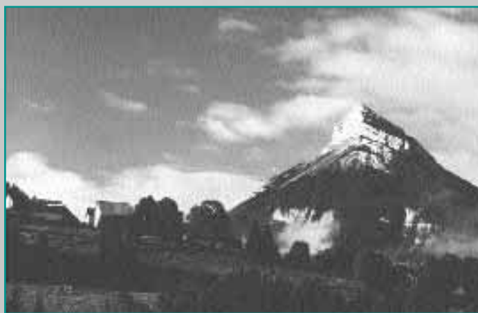
Parc naturel régional de Chartreuse - Chamechaude, 2082 m