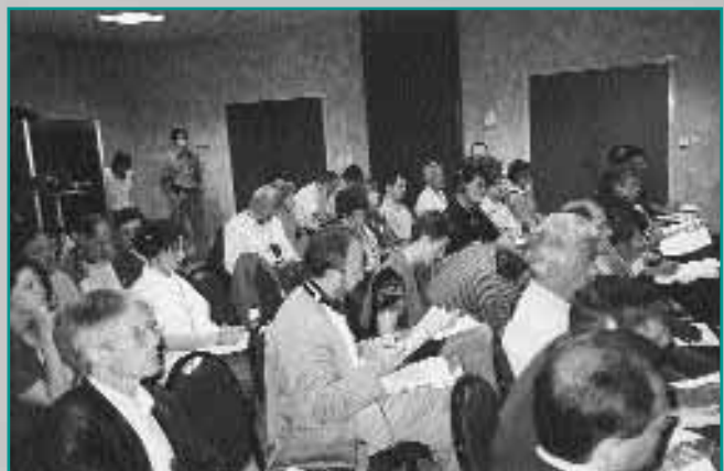
Participants aux premières rencontres internationales de Chambéry «Tourisme et espaces protégés»

au Lac du Bourget afin de pouvoir illustrer le sujet à partir d'exemples concrets. Ces rencontres ont pu se faire grâce au concours de la Région Rhône-Alpes.