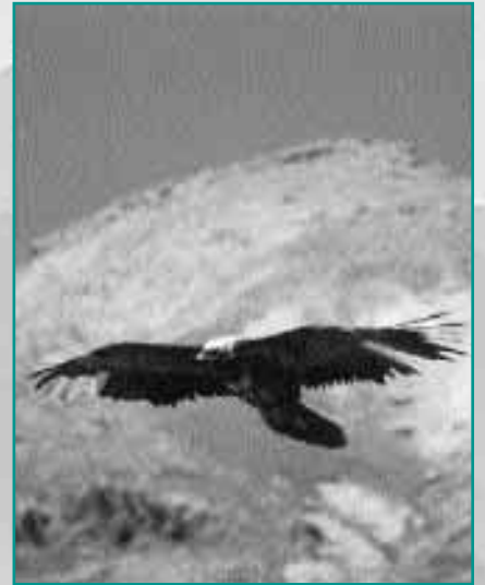
Gypaète barbu en vol

Parc national du Stelvio Bormio, le 24 avril 1998