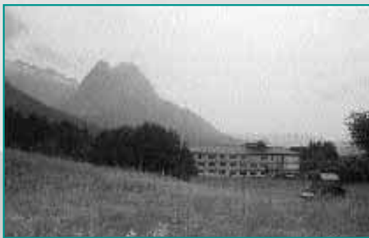
Institut de recherche alpine de Garmisch-Partenkirchen