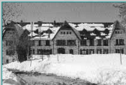
Centre d'Ecologie Alpine, Trento

38040 Viote Mt. Bondone (Trento), Italia