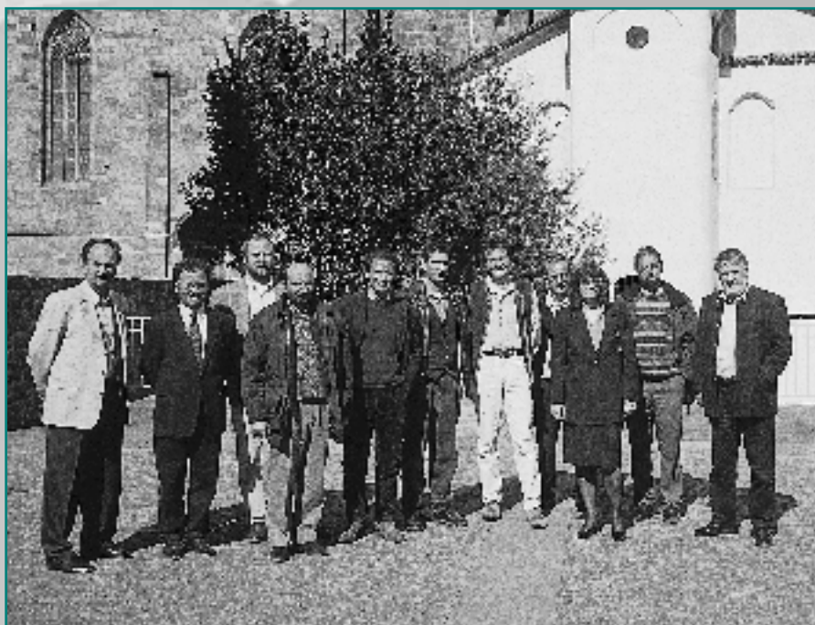
Bolzano, mars 1997 : Les participants

Réseau Alpin des Espaces Protégés Parc National des Ecrins