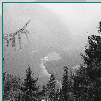
Parc National de Berchtesgaden, Königssee

Dans une première réunion, les grands axes de la