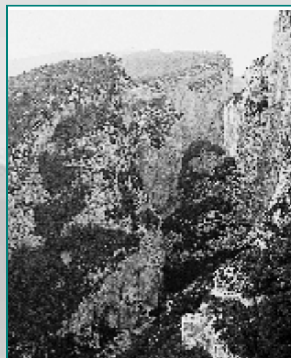
Gorges du Verdon